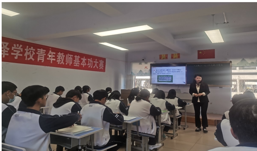
青年教师基本功大赛现场

根据学校学生的实际情况，进一步完善了新授课、练习课、讲评课、复习课“四课型”的课堂教学技巧，从基本要求、基本结构、基本方法等方面对四课型的教学过程进行细化，为青年教师的课堂教学方法提供了理论依据。举办了青年教师基本功大赛，通过板书项目、课堂教学项目、基本能力测试三个项目，对青年教师的教学能力进行了评分排名，取得较好效果。