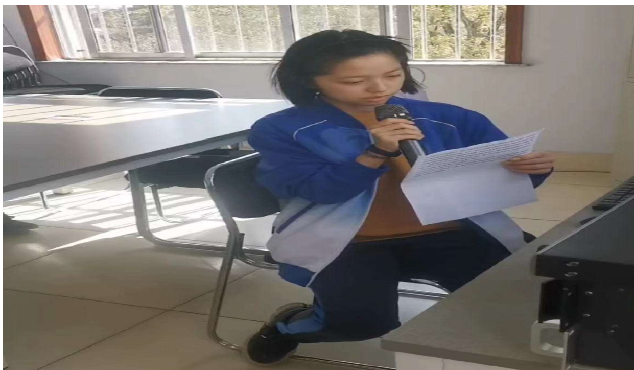
广播站同学宣传读稿