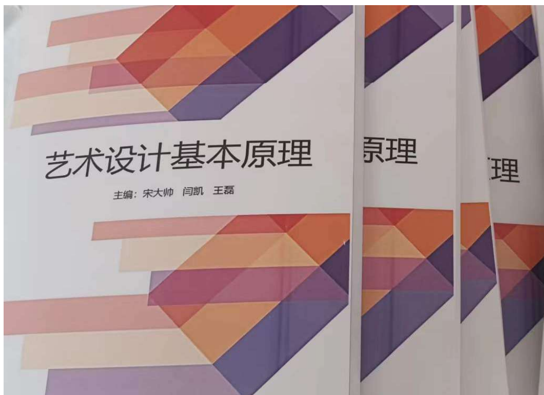
艺术设计电子材料（打印版）

师根据山东省春季高考艺术设计类的最新考纲，整理了 76199 字的电子教学材料，为艺术设计学生冲刺专业理论创造了良好的基础。