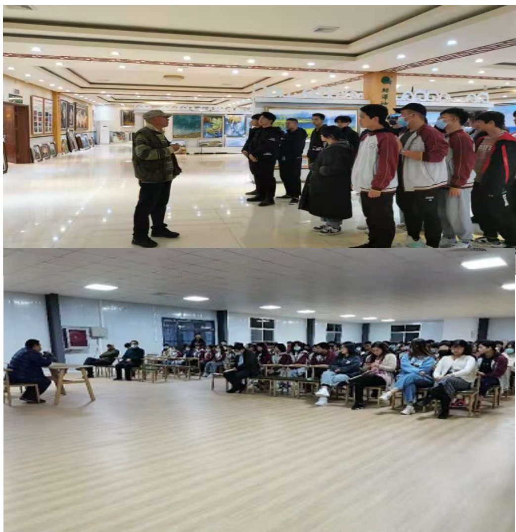
图为电子商务学生参观画室

整个流程下来,全体学生在老师的组织和引导下,积极参与,自主学习,教师的主导作用和学生的主体作用都得到了充分的发挥。学生在完成交易后,获得了书本上学习不到的处理商业问题,处理突发问题,与人沟通合作,与人谈判的技能,为就业打下了坚实的基础。